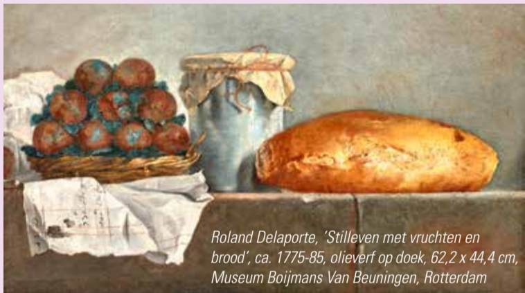
Roland Delaporte, 'Stilleven met vruchten en brood', ca. 1775-85, olieverf op doek, 62,2 x 44,4 cm, Museum Boijmans Van Beuningen, Rotterdam